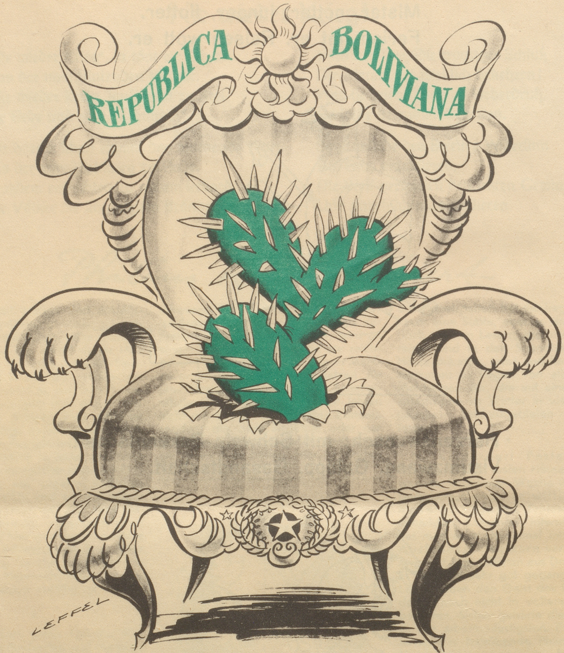
Der Sitz des Präsidenten