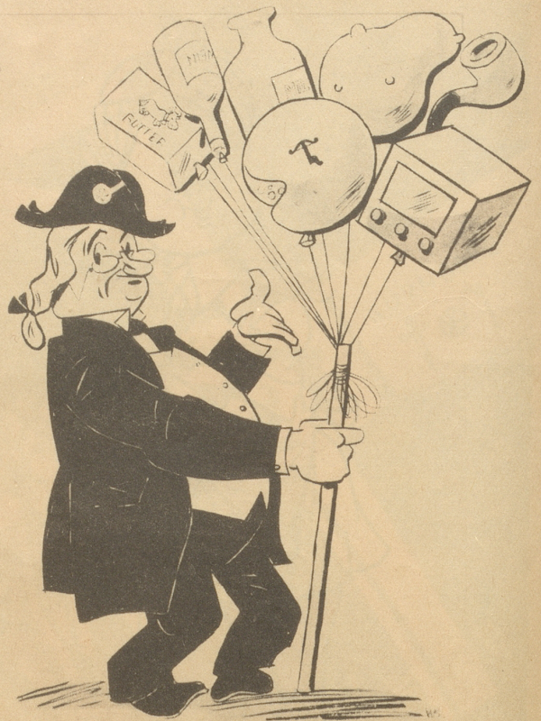
Milch - Käse - Butter - Kartoffel - Tabak - usw. - Preise steigen.