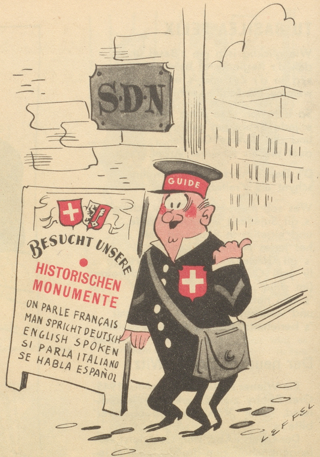
Auf daß wir wieder internationales Exkursionszentrum werden!