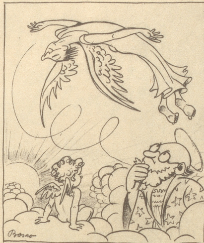
„Es isch halt en Akrobatik-Flüger!“