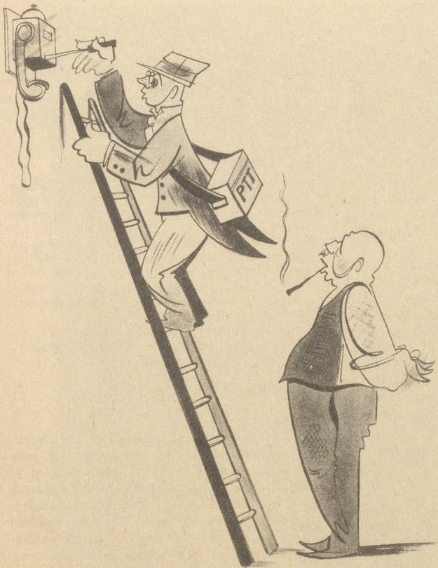
Erhöhung der Telephontaxen „Was wird ächt na alles höher ghänkt?“