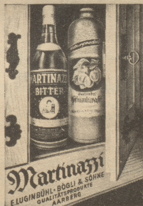
Martinazzi-Bar Mustermesse Basel Halle 14 Stand Nr. 4662

mit seinem originellen Bürgerkeller. Gut aufgehoben. Parkplatz Telefon (063) 412 84 Familie Luginbühl