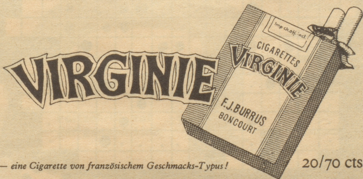
Virginie — eine Cigarette von französischem Geschmacks-Typus!

Rennt! Schuftet! Zahlt noch mehr Steuern! Ich bin zufrieden mit meiner