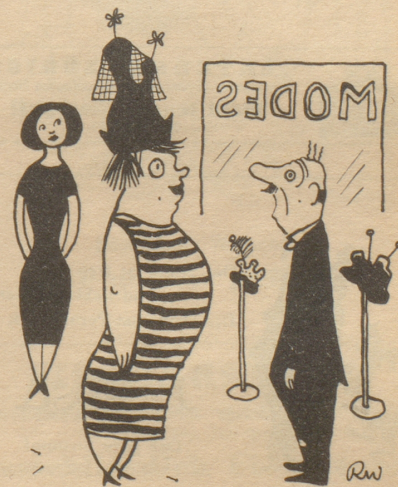
«Was, drühundert Franke für dä Huet! Du hesch de Grand-Prix errunge!»