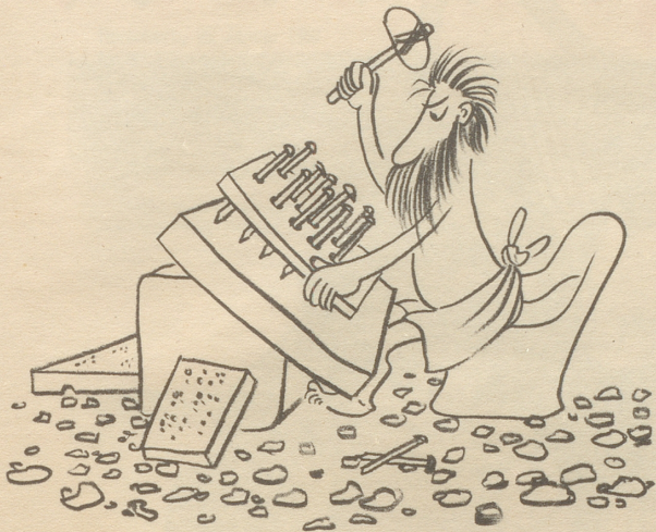
Der Vorläufer der Schreibmaschine: Die Meißelschablone