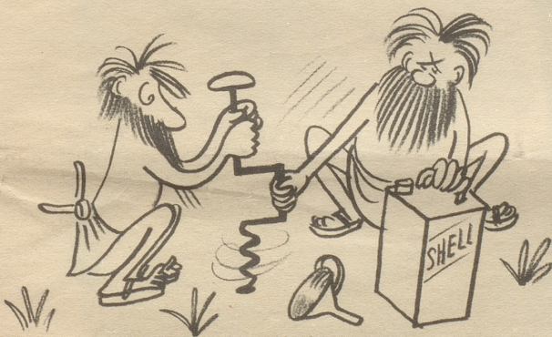
Erstmaliges Bohren nach Erdöl