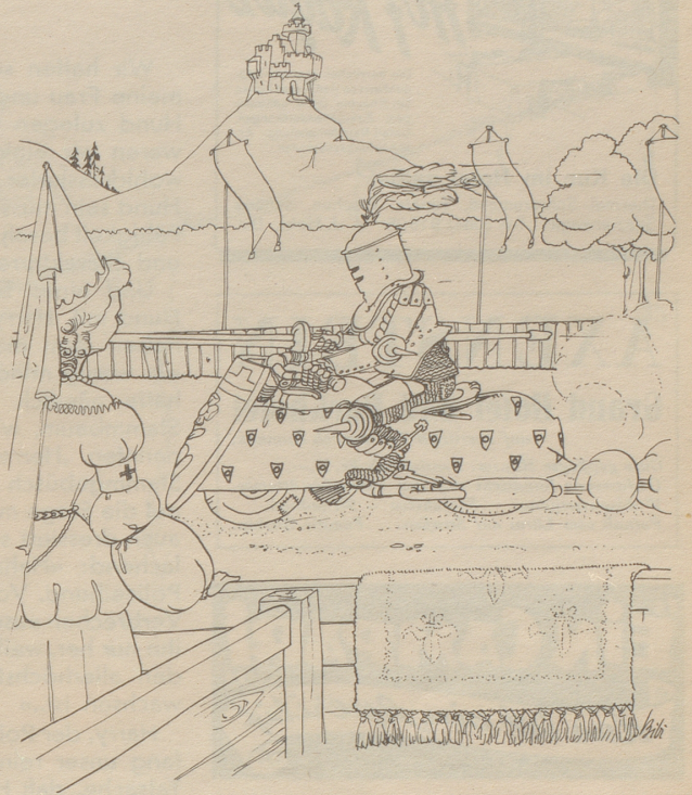
Fräser von Knatterschreck war ein Kämpfe, der durch sein forsches Draufgängertum auffiel.