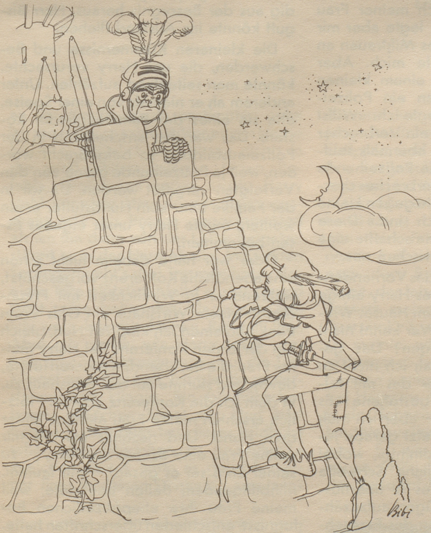
Es darf als erwiesen gelten, daß der Klettersport schon immer der verlockenden Aussicht wegen betrieben wurde.