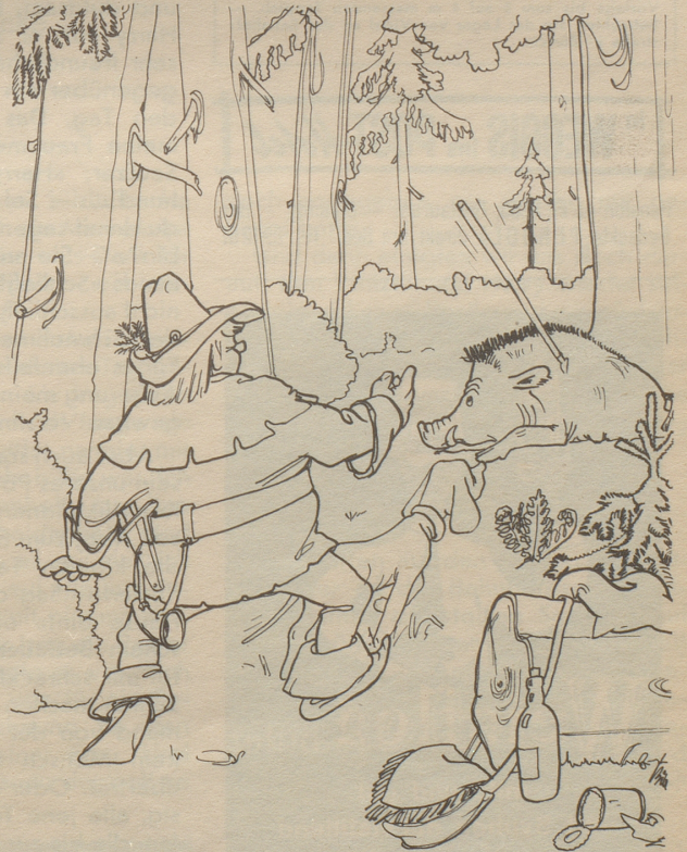
Wie mancher andere Sport vermag auch das Speerwerfen — sinnvoll ausgeübt — viel zum körperlichen Wohlbefinden beizutragen.