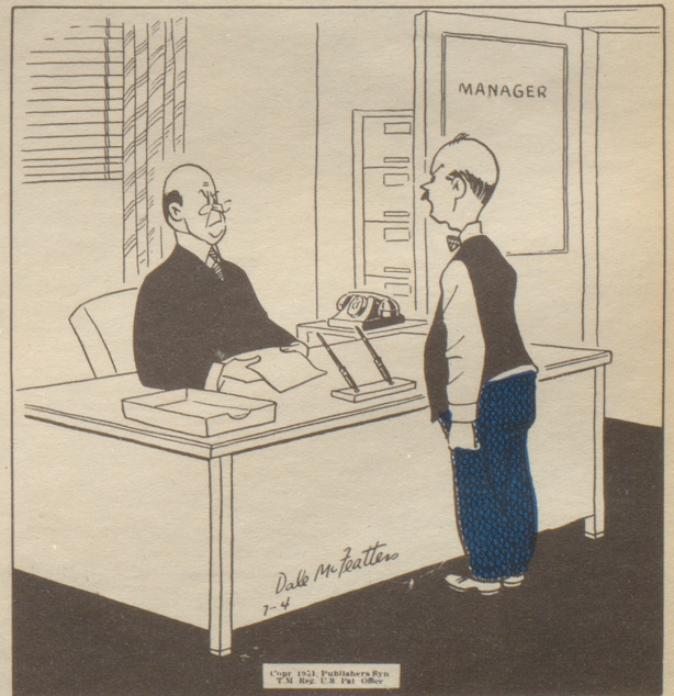
„Ich habe letzte Nacht geträumt, ich hätte Ueberstunden geleistet — und ich möchte dafür bezahlt werden!“