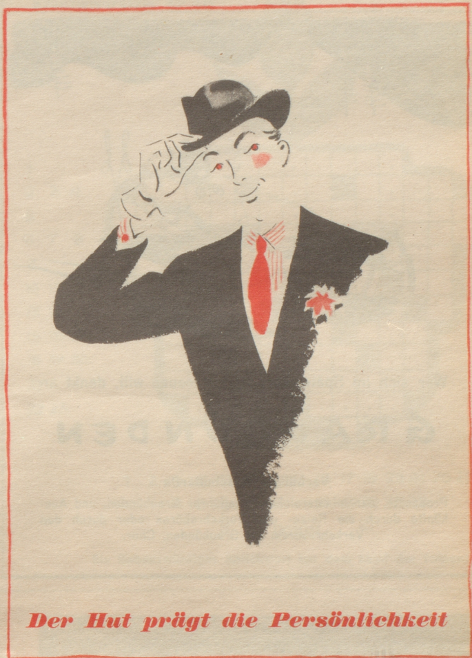
Der Hut prägt die Persönlichkeit

Herren-FORTUS: KUR Fr. 25.—, mittl. Packg. Fr. 10.—, Probe Fr. 5.—, 2.—. Damen-FORTUS: KUR Fr. 28.50, mittl. Packg. Fr. 11.50, Proben Fr. 5.75, 2.25, in Apoth. und Drog. erh., wo nicht, diskreter Versand durch Lindenhof-Apotheke, Rennweg 46, Zürich 1.