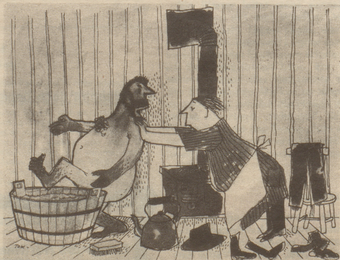
Wieder ist ein Jahr vergangen!