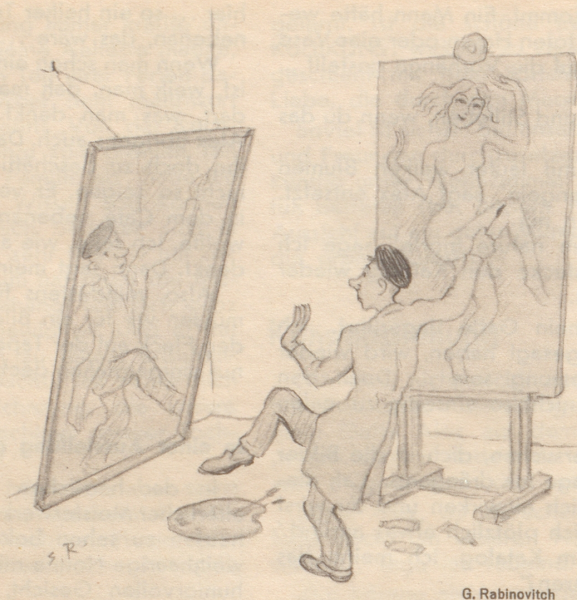
Selbst ist der Mann!