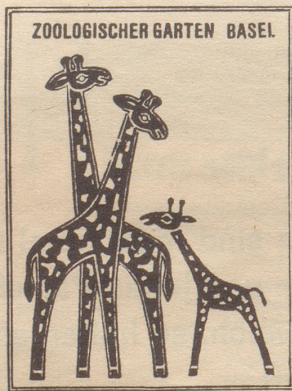
Zoo-Signet — gestern und heute!