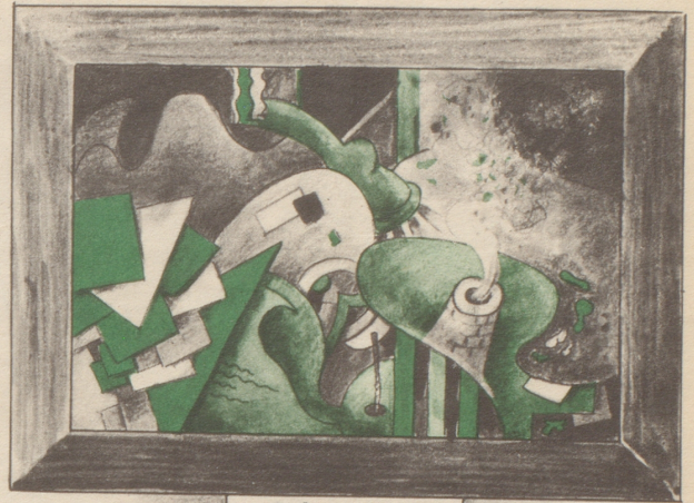
O. Birreweich „Die große Zeit“