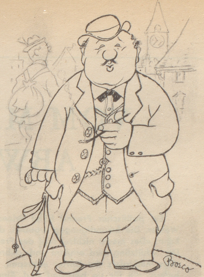
«Nimmt mi nu wunder, werum grad mich allpof en Frönde fröget, wo me hie guet ässi!»

Jetzt muß ich mich aber sicher entschuldigen, wenn ich nochmals auf den besagten Leitartikler zurückkomme. Ich begreife es nämlich schon, wenn einer soviel Poesie und Dichtung in seine Berichterstattung hineinbringt als möglich. Nicht nur wegen der Honorarsteigerung. Poesie ist nämlich bei uns überhaupt sehr geschätzt. Mindestens so sehr wie bei den alten Chinesen, die ja von einem Offizier in erster Linie verlangten, daß er ein schönes Gedicht schreiben könne. Und es ist alles nicht wahr, was man so schwätzt, daß in der Schweiz nur der Ferdi Kübler und der Hugo Koblet bekannt seien. Im Gegenteil, die Dichter und Weisen sind es, die man im hintersten Krachen kennt. Glauben sie's nicht? Thomas Mann hat's erlebt. Als er 1949 auf einer ihm zu Ehren veranstalteten kleinen Landpartie in ein Schweizer Dorf gelangte, kam eine alte Frau – wohlverstanden, irgend eine alte Frau – die von seiner Gegenwart gehört hatte, ganz einfach zu ihm und brachte ihm als Zeichen des Dankes ein Päckchen mit selbstgebackenen 'Kringeln'. Jawohl, so war's, denn so hab' ich es in einer seriösen Zeitschrift gelesen. Und ich finde das etwas sehr Schönes, wenn in einem Land jedes alte Frauli den Thomas Mann kennt und ihm mit selbstgebackenen 'Kringeln' dankt. Wissen möcht ich bloÙ noch, ob für den 'Doktor Faustus' oder für den 'Zauberberg'.