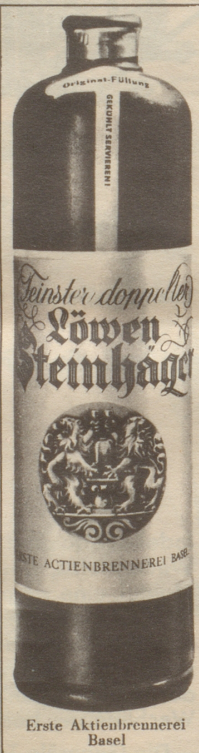
Erste Aktienbrennerei Basel