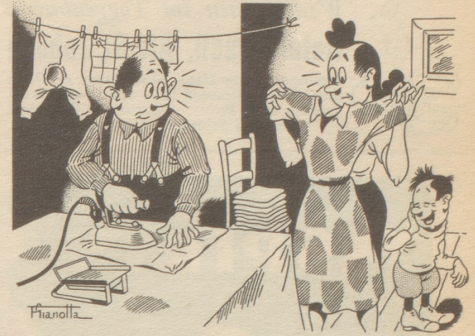
Papa macht den Haushalt

In Basel, dem friedlichen Städtchen, laufen mit vergnüglichem Schnattern noch die Gänse über die Straße, hast Du beobach-