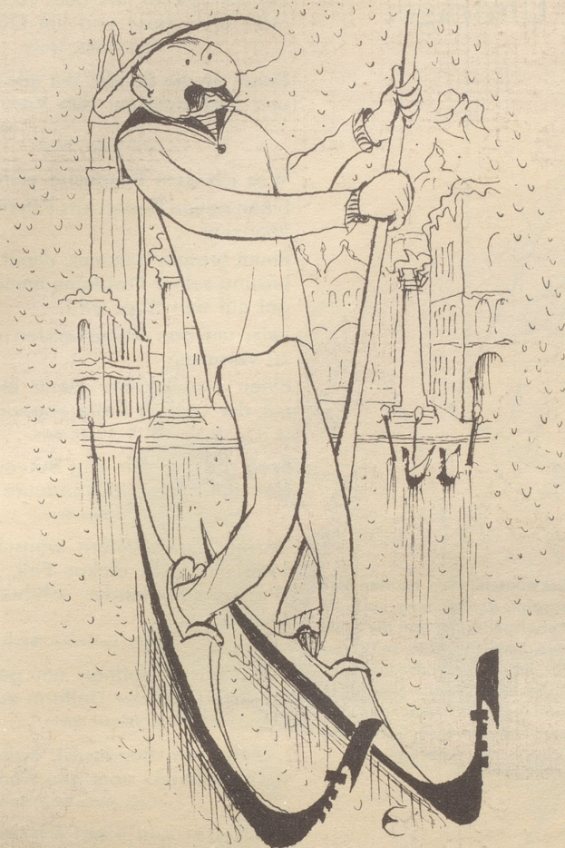
Kälte in Venedig