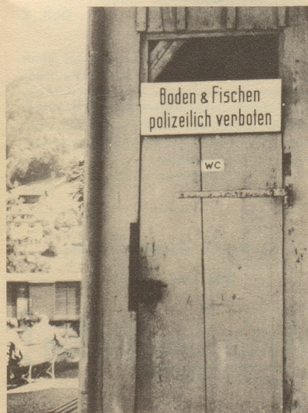
s wird au niemerem iifale!