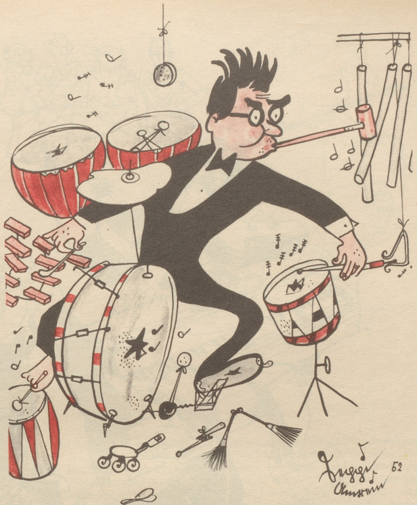
Der Mann, der sich buchstäblich durchs Leben schlägt