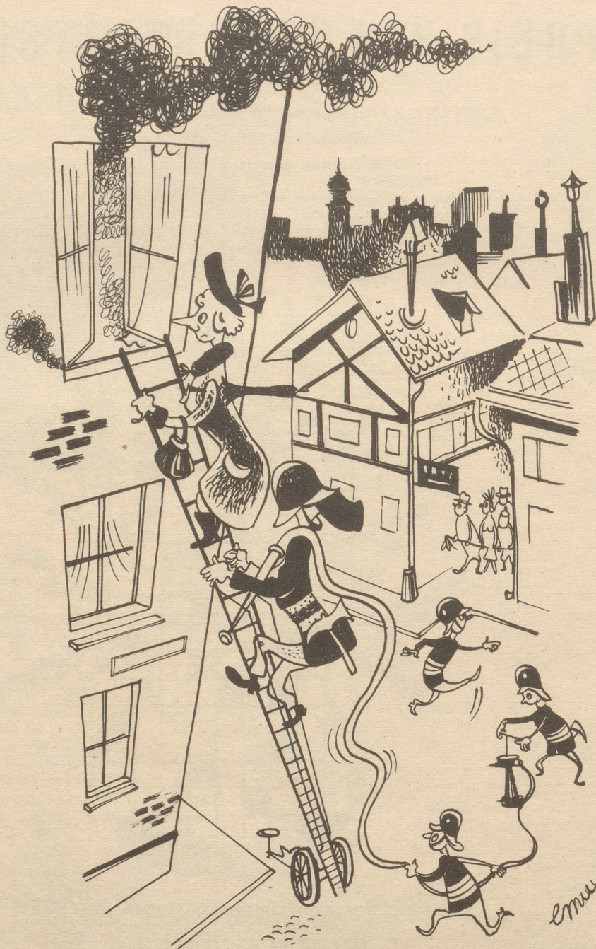
Die besorgte Feuerwehrmannsfrau