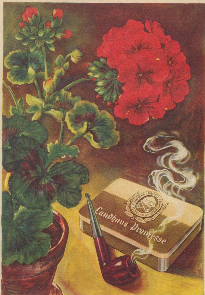
Ein Pfeifentabak mit natürlichem blumigem Aroma und auffallender Milde. Import-Klasse