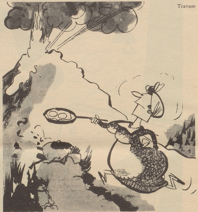
Atna in Tätigkeit

Neulich besuchte ich die Industriestadt Essen im Ruhrgebiet. Beim Gang durch die rußgeschwärzten Straßen kam ich in den Stadtteil Rüttenscheid und stieß dort unvermutet an einem Abend auf das traute Wort «Rütli», das in der Zusammensetzung «Rütli-Kino» in riesigen Leuchtbuchstaben an der Außenwand eines Hauses prangte. Ich vermutete, daß der Kinobesitzer ein Schweizer sei, der hier in der Ferne seinem Heimatlande habe ein Denkmal setzen wollen. Ich begab mich in das Innere, um dem Rütli-Besitzer landsmannschaftlich die Hand zu drücken. Vorsichtigerweise fragte ich aber die Dame an der Kasse zuerst, was der Name «Rütli» hier zu bedeuten habe. «Na», lautete die Antwort, «das weiß doch hier jedes Kind! Rütli, das ist die Abkürzung für Rüttenscheider Lichtspiele!» FB