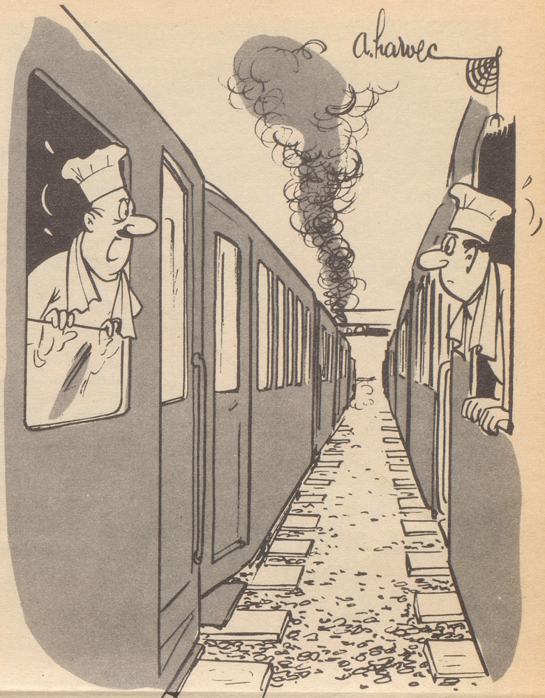
Speisewagen kreuzen sich

könnte man die folgende wahre Geschichte nennen. Der frühere amerikanische Soldat McHale stand vor dem Polizeirichter in Montreal, weil er angeblich versucht hatte, durch ein Fenster in die Wohnung einer Dame einzusteigen. Mit einem Schreckensschrei war die Dame zurückgefahren, als sie den unbekanntenen Mann im Fenster erblickte, der sich anschickte, sich in ihr Zimmer zu schwingen, und hatte die Polizei alarmiert. Im Verlauf seiner Verteidigung, die durch seine Freundin bestätigt wurde, gab McHale bekannt, daß er keineswegs einen Einbruch geplant hätte. Er wollte nur nach längerer Abwesenheit von Montreal wieder sein Girl besuchen und seitdem er in Bayern das «Fensterln» gelernt hatte, praktizierte er seine Besuche nur auf diesem Wege. Inzwischen hatte aber seine Freundin die Wohnung gewechselt und so hatte er sich einer wildfremden Dame gegenüber gesehen, die ihrerseits an seinen ehrlichen Absichten gezweifelt hatte. Michel