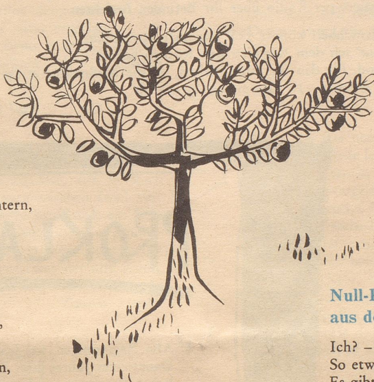
Illustrationen von Alfred Kobel