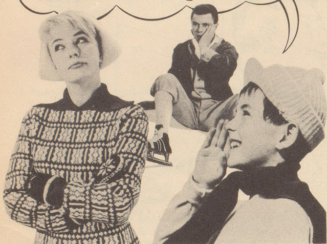
Was Peter erfuhr!