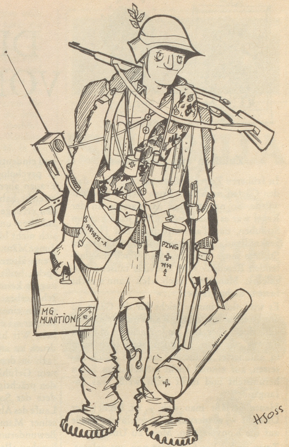
«Gopfriedschtutz mi Hoseträger ...»