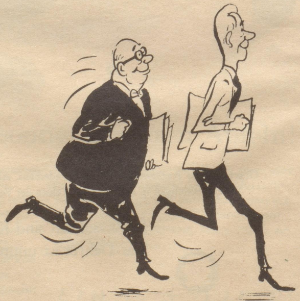
wenn er klug ist, macht er mit.