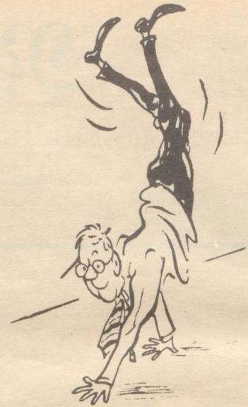
Ein bißchen Akrobatik kommt der Verdauung zugute –