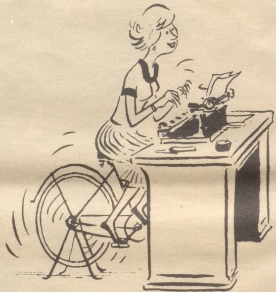
Das 'Tretopult' sorgt für Bewegung ohne Arbeitszeitverlust ...