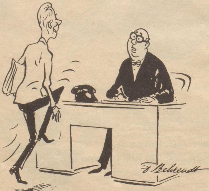
Beim Gang zum Chef ist Laufschrift förderlich,