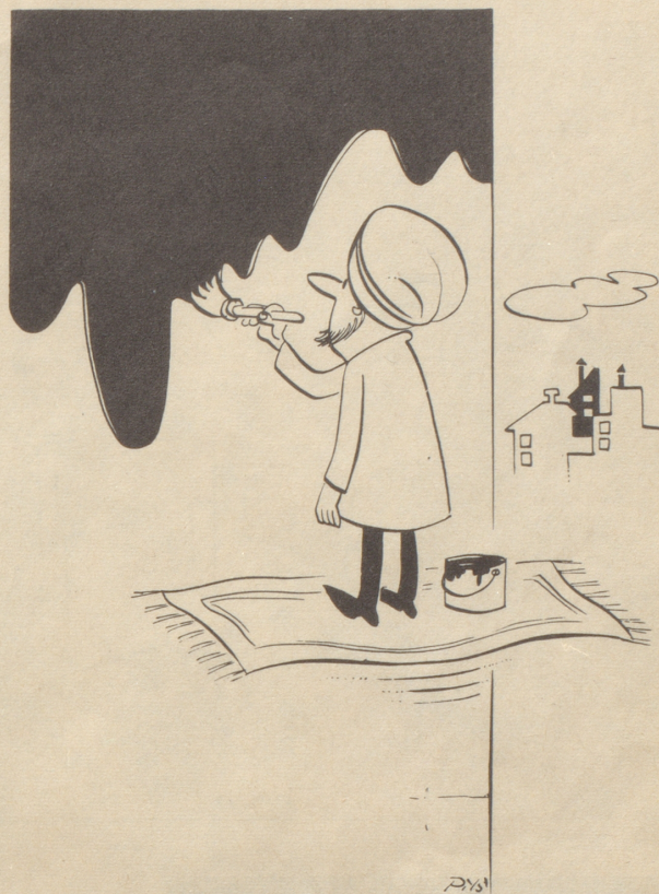
Malerei leicht gemacht