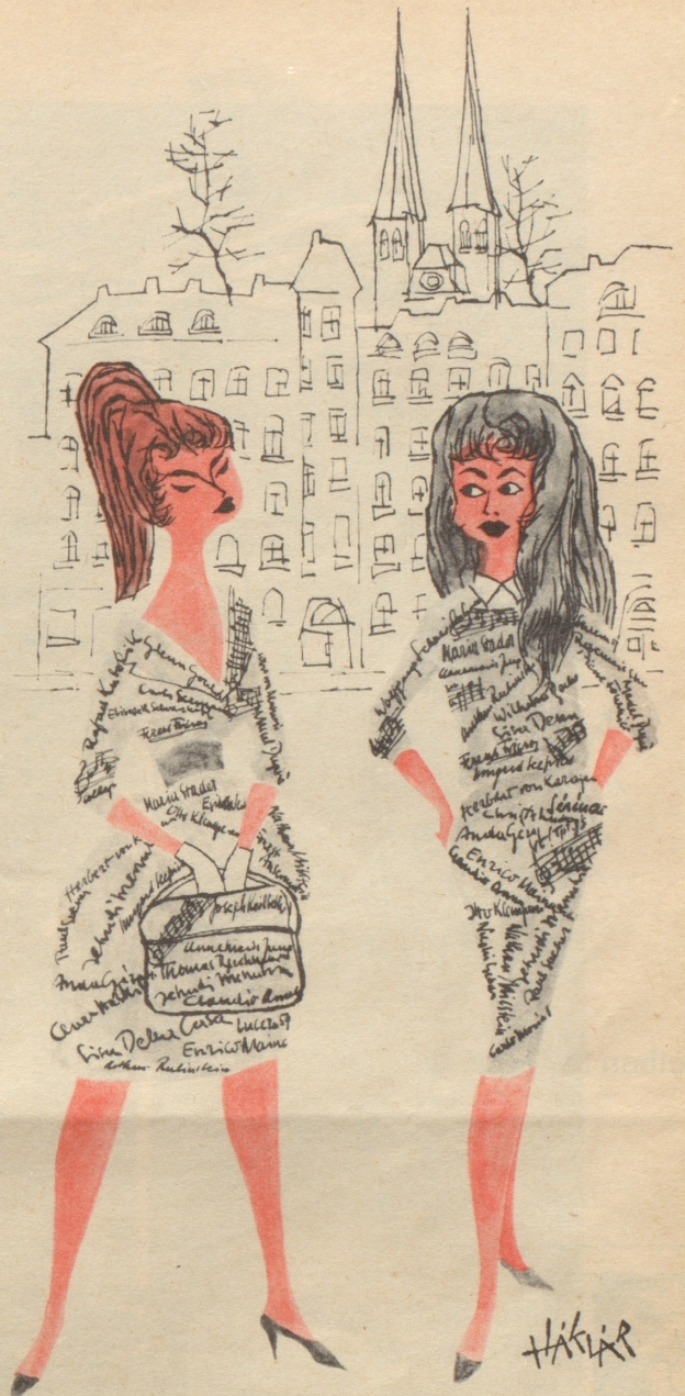
Autogramm-Jägerinnen verlassen die Luzerner Musikfestwochen!