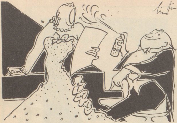
in C-Dur singt sie schön und fein mit air-fresh bleibt die Luft so rein