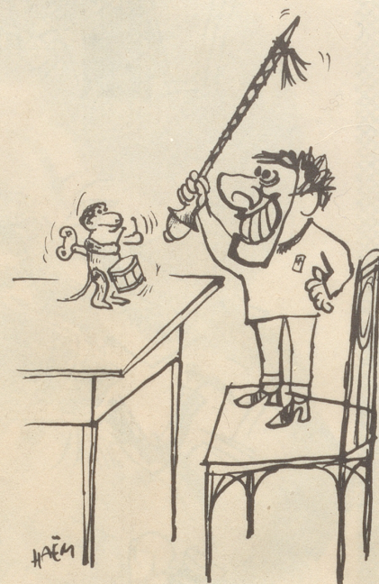
Der Tag vor dem Morgenstreich

«So, so», staunt Bobby. «Und wie hieß die Stadt vor dem Erdbeben?» *