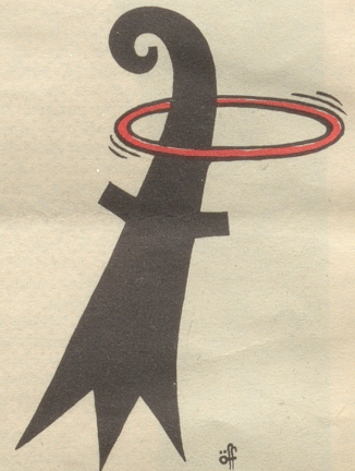
Gruß aus Basel