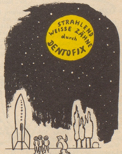
was jetzt im Sektor Mond zu befürchten ist - - -

Glauber ers, as d Gescht im «Bären» ammen e göttligi Freud hei, wenn das Gschichtli vom Schwingerkönig uf s Tapeet chunnt. KL