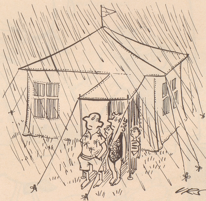
in den Ferien