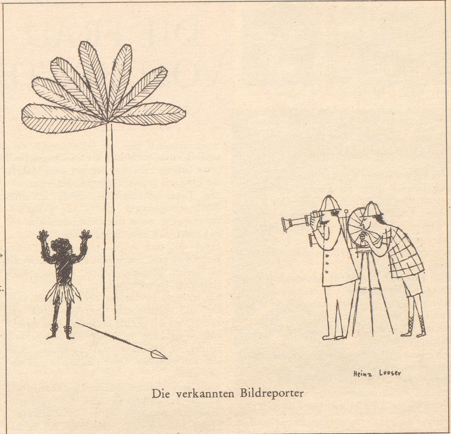
Die verkannten Bildreporter