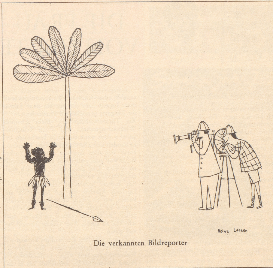
Die verkannten Bildreporter

essiert vor allem der Sprung des Atomphysikers Prof. Oppenheimer, der mit nahezu einem halben Meter Höhe fast die Leistung der von ihm errechneten Raketen egalisiert .. Und nun ist die Reihe an uns! In allen Stuben und Stübchen wird bereits unermüdlich geübt, damit uns der Appell «Frisch gehüpft ist halb getestet» nicht unvorbereitet erreiche!