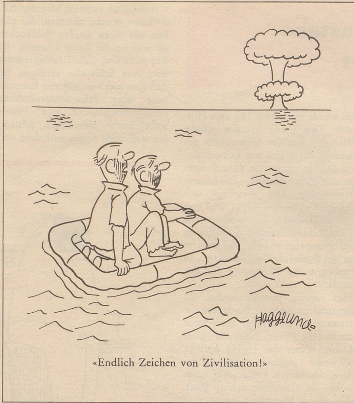
«Endlich Zeichen von Zivilisation!»