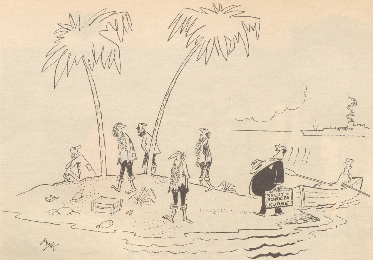
«Wer von Euch hat die Flaschenpost geschrieben?»

ja absetzen kann, weil es unter «Kultur» fällt. Die mittellosen Schriftsteller, darunter auch ich (deshalb kenne ich diese Geschichte so genau) dichteten Lobeshymnen in modernen Rhythmen auf ihn, so daß er unsterblich wurde. Und so hielt er es zeitlebens. Lief ihm unversehens ein armer Kerl in den Weg, so steckte er diesem einen Geldschein in die Tasche, getreu seinem Schwur, was mich wiederum veranlaßte, ihm verschiedene Male zu begegnen, indem ich, um ihm nicht aufzufallen, meine Kleidung wechselte und mir verschiedentlich auch Bärte anklebte. Er tat es bescheiden und ohne viel Worte darüber zu verlieren. Er wußte ja aus eigener Erfahrung, wo einem, der nichts besaß, der