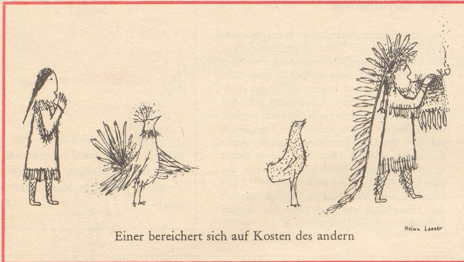
Einer bereichert sich auf Kosten des andern