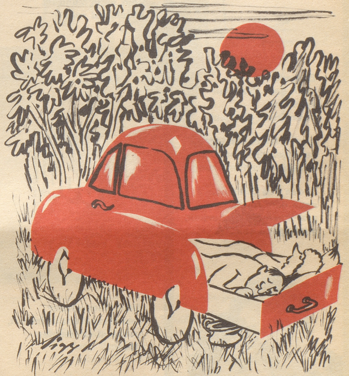
Liegesitze nun auch für den Kleinstwagen