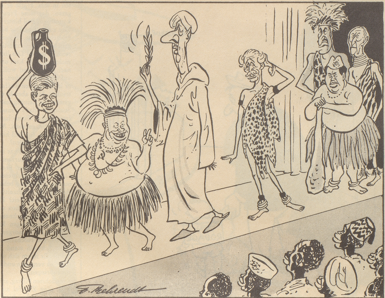
«African look» - die politische Frühlingsmode