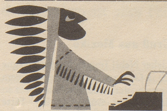
...ich, der "Grosse Bär", Häuptling der tapfern...*