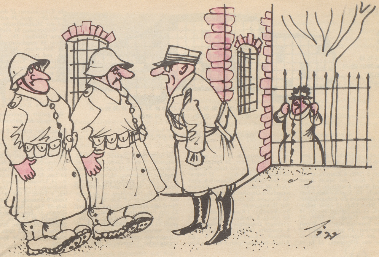
«Ganz rächt Herr Haupme, genau das säg ich ihm au all Tag!»