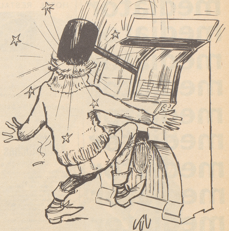
Aus unserer Erfindermappe