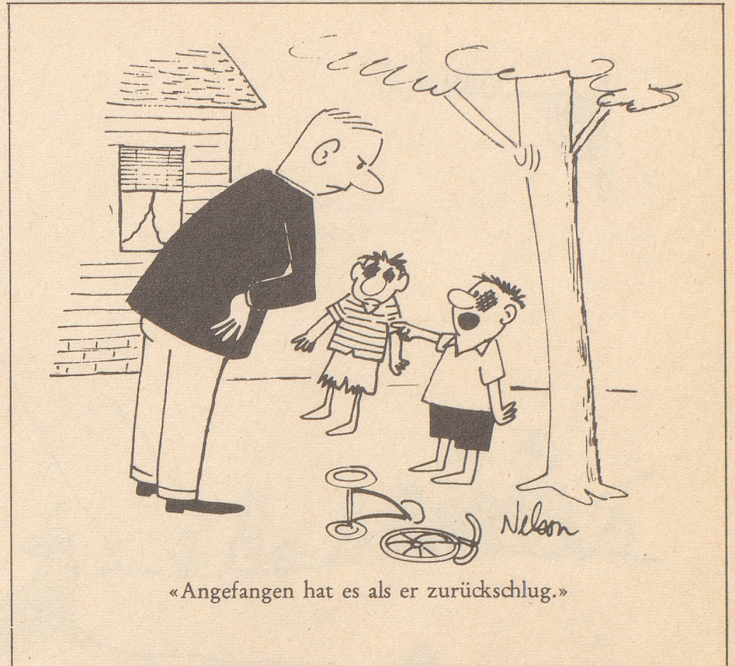
«Angefangen hat es als er zurückschlug.»

Feuer breitet sich nicht aus, hast Du MINIMAX im Haus!