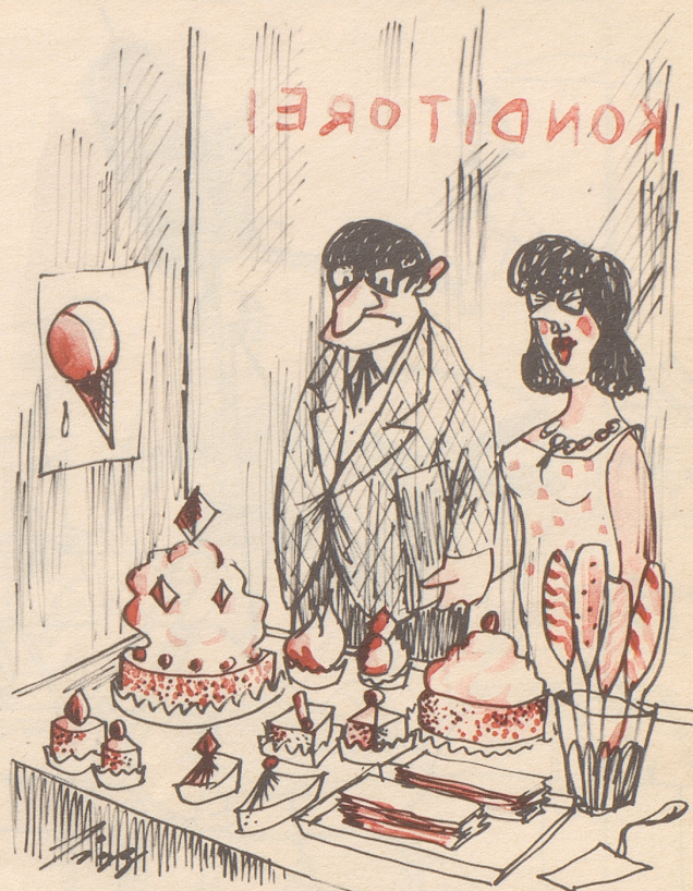
Die Inspiration des Architekten

«Da kommt mir grad eine neue Idee für einen Kirchenbau!»