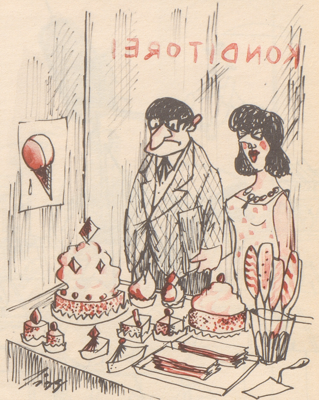
Die Inspiration des Architekten

«Da kommt mir grad eine neue Idee für einen Kirchenbau!»